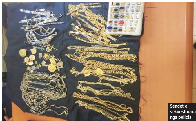
Sendet e sekuestruara nga policia