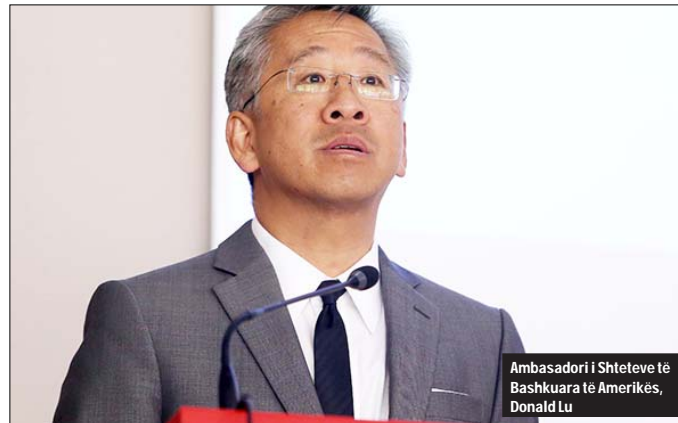
Ambasadori i Shteteve të Bashkuara të Amerikës, Donald Lu

"Ata duhet të arrestohen, të dënohen maksimalisht"