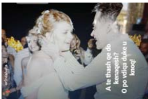
A të thashë që do kenashej? O po vdiqa duke u kërcyer!

Uron për ditëlindjen e Turit por "pendohet", çfarë postoi Orinda