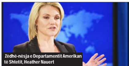
Zëdhënësja e Departamentit Amerikan të Shtetit, Heather Nauert

SHBA dhe Rusia vijnë të përplasen për çështjen e diplomatëve. Zëdhënësja e Departamentit Amerikan të Shtetit, Heather Nauert ftoi Moskën që të mos sillet si viktimë dhe paralajmëroi se nuk do të qëndronin duarkryq. Administrata "Trump" nuk e ka mirëpritur aspak vendimin e Moskës për të shpallur "non grata" 60 diplomatë amerikanë dhe mbylljen e Konsullatës së SHBA në Shën Peterburg. Në një reagim pas kundërpërgjigjes ruse, zëdhënësja Nauert tha se nuk ka asnjë justifikim për dëbimin e diplomatëve amerikanë. Ministri i Jashtëm, Sergei Lavrov tha se diplomatët kanë afat të largohen deri më datë 5 prill me