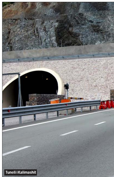
Tuneli i Kalimashit