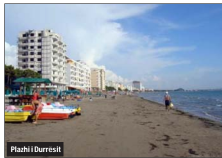
Plazhi i Durrësit

T aksa e vendosur për Rrugën e Kombit ka zemëruar kosovarët, të cilët janë turistët më patriotë të vendit tonë dhe kryesisht të bregdetit Adriatik. Dje, në ditën e dytë të aplikimit të kësaj takse në tunelin e Thirrës në Kukës, e cila përkoi me fundjavën e fundit të marsit, që u shoqërua me diell e temperatura të larta në plazhin e Durrësit, numri i kosovarëve të mbërritur është në minimumin e tyre historik. Burime nga agjencitë turistike dje bënë me dije se autobusët e nisur nga qytete të ndryshme të Kosovës kanë mbërritur bosh në Durrës, ndërkohë që pritej fluks për shkak të motit të mirë. "Zemërimi i kosovarëve është i madh", thanë shoferët e autobusëve të Kosovës, të cilët kanë paguar taksën e hyrjes 11 euro e 30 cent në kufti. "Me 19 veta nga 51 që duhet të vinin, kaq erdhën nga Gjilani këtë mëngjes. Populli është indinjuar, pasi taksa është vënë vetëm për të bllokuar kosovarët dhe kuksiatë që të mos vijnë në Tiranë e në Durrës. Kjo është shumë e rëndë", u shprehën shoferët nga Kosova.