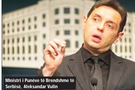
Ministri i Punëve të Brendshme të Serbisë, Aleksandar Vulin

ALEKSANDËR VULIN "Ata të gjithë po punojnë kundër interesit të Serbisë për ta zgjidhur çështjen me Kosovën. Fuqitë e mëdha po punojnë që të parandalojnë Serbinë që të vendosë për veten dhe të zgjidhë problemin me Kosovën" është shprehur Vulin.