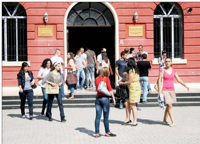
(Në foto) Studentë

Plotësohen vendet edhe në Universitetin e Mjekësisë. 26 fitues në Fakultetin Juridik. Regjistrimet në 27-28 shtator, shans edhe në raundin e tretë