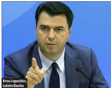
Kreu i opozitës, Lulzim Basha