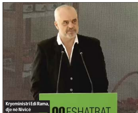
Kryeministri Edi Rama, dje në Nivicë

"100 fshatrat", emigrantët të investojnë në vendlindje