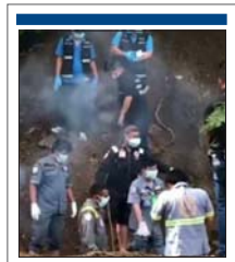
Tajlandë, gjenden të vdekur milioneri dhe gruaja e tij

Hoxha thotë se janë përgatitur materialet e nevojshme për ta njoftuar këtë grup për progresin e arritur. Grupi Punues për Vizat (COWEB), i cili funksionon në kuadër të Këshillit të Bashkimit Evropian, nesër dhe pasnesër do të qëndrojë në Kosovë për të parë nga afër punën që është bërë nga institucionet kosovare sa u përket reformave, posaçërisht rreth sundimit të ligjit dhe të aspekteve tjera që ndërlihen me këtë proces. Ministria e Integritimit Evropian, Dhurata Hoxha ka thënë se Kosova ka përgatitur të gjitha materialet përkatëse për ta njoftuar këtë grup rreth punëve që janë bërë. Pas mbështetjes nga COWEB, çështja e heqjes së regjimit të vizave për Kosovën kalon në nivelin e ambasadorëve, që njihet si COREPER dhe në fund kërkohet miratimi nga ministri i vendeve anëtare të BE-së. Nga ana tjetër, ditën e djeshme nisi asambleja e përvitshme e OKB-së në Nju Jork ku sekretari i Përgjithshëm i Kombeve të Bashkuara, Antonio Guterres pritet të paraqesë një imazh të zymtë të shteteve në botë. Këtë vit, 133 liderë botërorë kanë njoftuar se do të jenë pjesë e sesionit në Asambelën e Përgjithshme, e cila përfundon punimet më 1 tetor. Mes pjesëmarrësve këtë vit janë edhe presidenti i Kosovës, Hashim Thaçi si dhe kryeministria serbe, Ana Brambiç.