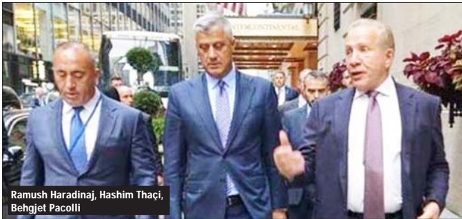
Ramush Haradinaj, Hashim Thaçi, Behgjet Pacolli