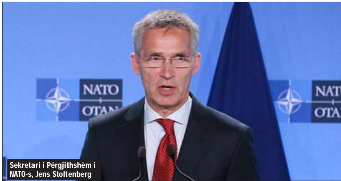
Sekretari i Përgjithshëm i NATO-s, Jens Stoltenberg