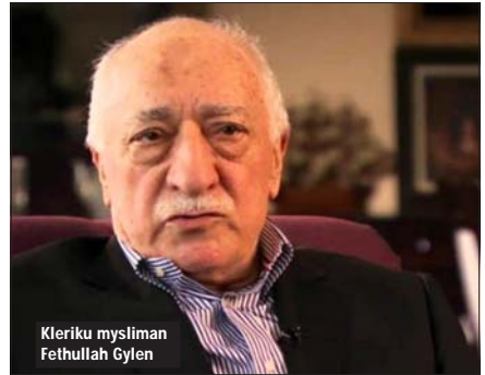
Kleriku mysliman Fethullah Gylen