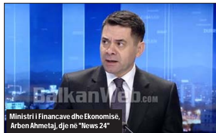
Ministri i Financave dhe Ekonomisë, Arben Ahmetaj, dje në "News 24"

Ministri i Financave dhe Ekonomisë, Arben Ahmetaj tha se është hera e parë pas 28 vitesh që qeveria investon për rikonstruksionin e konvikteve në Qytetin Studenti. I futur në rubrikën "Opinion" në News24, Ahmetaj u shpreh se janë 19 milionë euro për rikonstruksionin e të gjitha konvikteve, ndërsa e konsideroi protestën e studentëve si të pastër dhe racionale. "Studentët e ekselencës do marrin shpërblim dhe këtë do e favorizojë buxheti i shtetit. Nëse është nevoja për të prekur ligjin e arsimit të lartë e prekim, por hajde ta diskutojmë dhe e ndryshojmë. Akti i parë i besimit është se një nga anëtarët që kemi në bord ne ia kalojmë studentëve. Është hera e parë në histori pas 1990 që investohet në konvikte. Unë kam jetuar vetë në konvikte dhe është hera e parë që investojmë në ato konvikte. Janë 19 milionë euro. Sot kryeministri ka folur me KfV që të vazhdojmë edhe me godinat e tjera. Ne e dimë që ka probleme dhe prandaj nisëm investimin. Kjo qeveri nuk ka nevojë që të shkundet për të kupa-