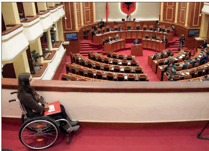
(Në foto) Një studente paraplegjike, në llozhen e parlamentit, gjate një seance plenare

Fondi do të shpërndahet për familjet që përfitojnë ndihmë ekonomike, personat me aftësi të kufizuar e të verbërit. Qeveria: Gjithsej 130 mijë përfitues