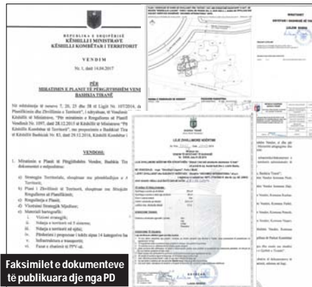
Faksimilet e dokumenteve të publikuara dje nga PD