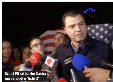
Kreu i PD-së Lulzim Basha me banorët e "Astirit"

"Protestë kundër projektit klientelist të Ramës"