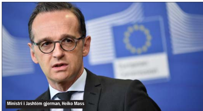
Ministri i Jashtëm gjerman, Heiko Maas