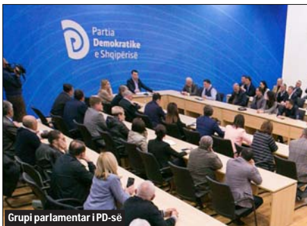
Grupi parlamentar i PD-së