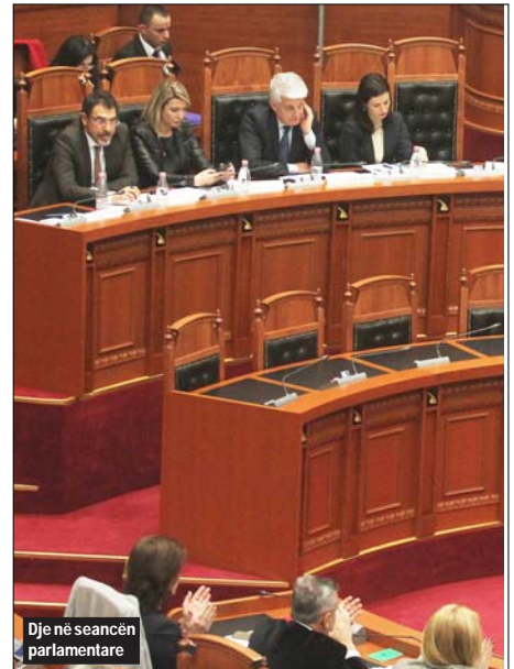
Dje në seancën parlamentare

putetët e opozitës. Kjo pasi drejtuesit kryesorë të opozitës, përfshi kryetarin e PD-së Lulzim Basha, ish-kryeministrin Sali Berisha dhe kryetaren e LSI-së, Monika Kryemadhi, kryetari i Kuvendit duket se i ka favorizuar. Të tre atyre u janë njohur vetëm 4 mungesa, ndërsa janë paguar me 97 mijë lekë të reja.