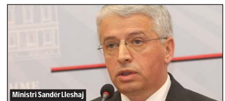
Ministri Sandër Lleshaj