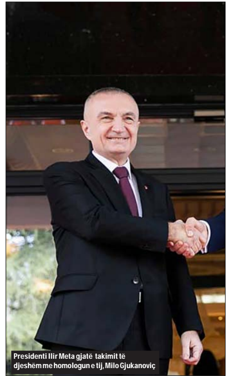
Presidenti Ilir Meta gjatë takimit të djeshëm me homologun e tij, Milo Gjukanoviq