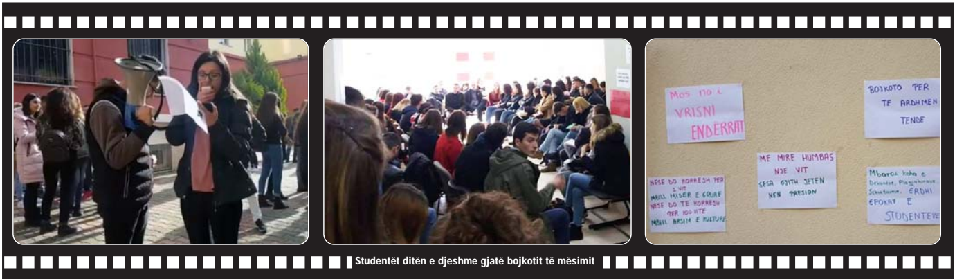
Studentët ditën e djeshme gjatë bojkotit të mësimin

"Në master do të paguajmë miliona, pedagogët do të vazhdojnë me abuzimet e tyre"