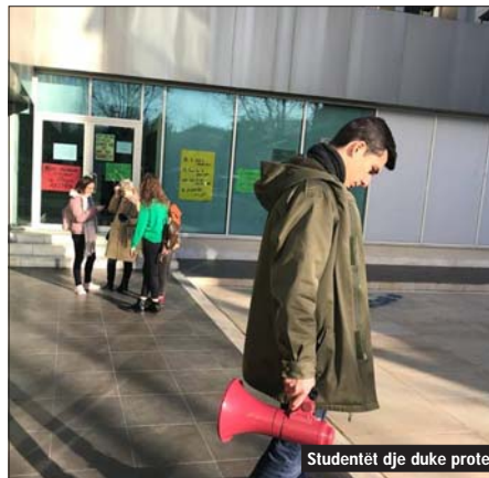
Studentët dhe duke protestuar për plotësimin e kërkesave

janë krejtësisht në kundërshtim me frymën demokratike të një universiteti të lirë. "Unë sot jam në grevë, si anëtar i thjeshtë, i barabartë, përtej ndarjeve departamentale, i asamblesë të Fakultetit Histori-Filologji të Universitetit të Tiranës. Sepse unë refuzoj të bëj mësim në një universitet që kthehet në një regjim kazerem. Sepse VKM e fundit janë krejtësisht në kundërshtim me frymën demokratike të një universiteti të lirë! Sepse unë jam për një model të ri universitar shqiptar: por jo që kriza e protestave studentore të hidhet mbi demokracinë universitare. Nuk ka kuptim që fillimisht na imponohen VKM autoritare dhe pastaj na thuhet hajde diskutojmë për paktin e universitetit! Pedagogët dhe studentët nuk janë debila! Mos i humbni ditët dhe orët pedagogëve dhe studentëve që duhen harxhuar për dijen dhe shkencën! Unë sot jam në grevë!", - thekson Fuga.