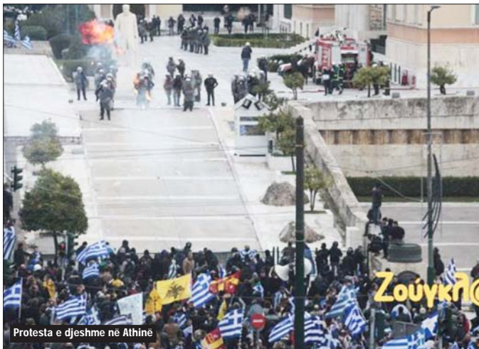
Protesta e djeshme në Athinë