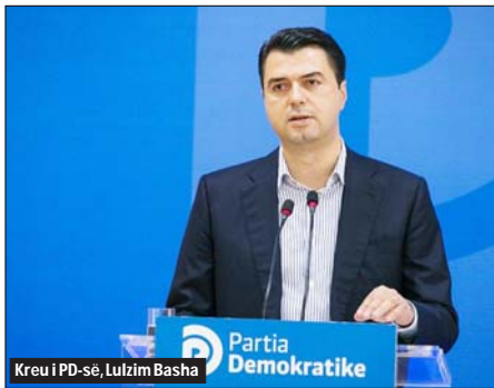
Kreu i PD-së, Lulzim Basha