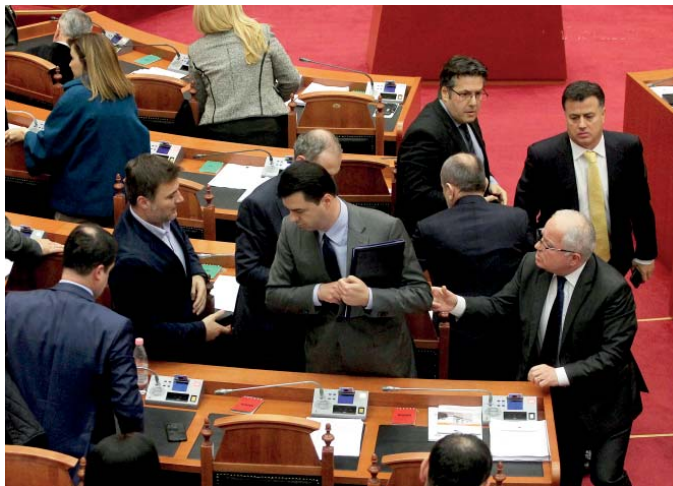
(Në foto) Kryetari i PD, Lulzim Basha dhe deputetët e PD duke u larguar nga seanca e djeshme parlamentare

Rama bëhet ministër i Jashtëm me 78 vota: Sa të ketë PS, s'vini në pushtet. Basha: Je bërë si Enveri, ministrat kukulla. Gjykata e Tiranës dënon kreun e PD për shpifje